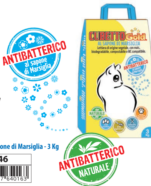
Cubetto Gold Naturale - 3 Kg

Lettieria naturale per gatti 100% a base di Mais, ad azione antibatterica, ad alto potere assorbente, ultra agglomerante ma soprattutto amica dell'ambiente. A piccole dosi si può smaltire anche direttamente nel WC o nel rifiuto organico urbano, salvaguardando l'ambiente. Totalmente biodegradabile, ed è prodotta senza l'aggiunta di additivi chimici e coloranti. Soffice sotto le zampe dei gatti, non graffia i pavimenti e non si attacca al fondo della lettiera.