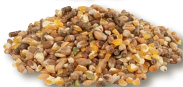
mix miscele di grani + speciali pellets (per la deposizione o per la crescita)