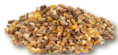
miscela miscela di grani + pellet da 3mm per ovaiole