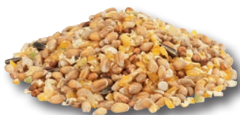
Miscela di grani piccoli

Le miscele GRA-MIX sono alimenti che dovrebbero essere ben razionati (somministrare fino ad un massimo del 15% della razione giornaliera).