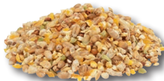
Miscela pollame & fagiani