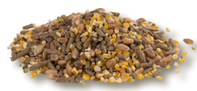
miscela miscela di grani + pellet da 2mm per ovaiole