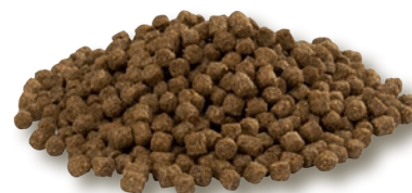
Floating Sea Duck