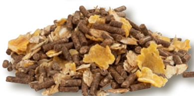
muesli miscela con fioccati e pellets