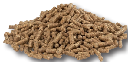
CRANE pellettato - pellet di 3mm