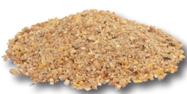
sfarinato per pulcini

Questi alimenti sono disponibili in varie forme di prodotto come, sfarinato, sbriciolato, pellet e mix".