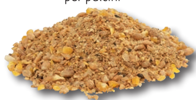
sfarinato per ovaiole